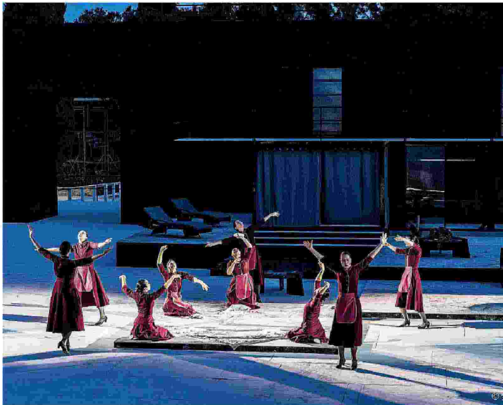
Alcesti Lo spettacolo di ieri sera al Teatro Greco di Siracusa