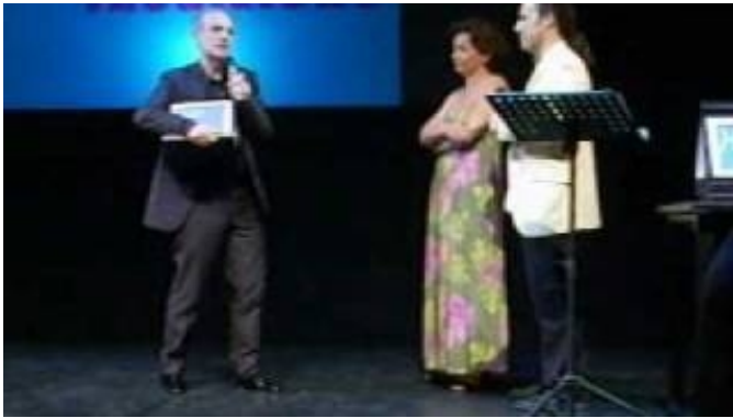
Premio Hystrio alla carriera 2009