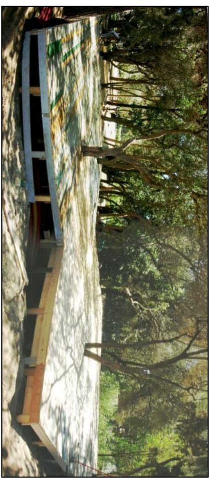
PARTICOLARI DEL PEDANAMENTO IN FASE DI ESECUZIONE