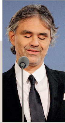
DEDICATO AI TERREMOTATI Il concerto di Bocelli si terrà al Colosseo

● VENEZIA - Un momento magico di una piccola ma grande storia, come quelle che raccontano nelle loro animazioni, quello della Pixar che accoglie con un coro di grazie il Leone d'oro alla carriera della Mostra del Cinema di Venezia al suo patron John Lasseter. Il Leone d'oro sarà consegnato a Venezia a settembre durante la 66/a Mostra Internazionale d'Arte Cinematografica che dedica una due giorni alla Pixar durante i quali ci sarà la prima mondiale di Toy Story e Toy Story 2 in 3D.