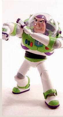
TOY STORY IN 3D Una delle creature della Pixar